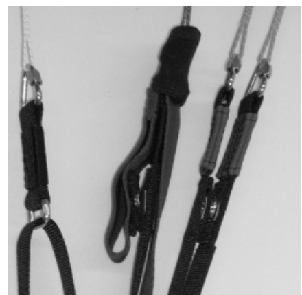
B- Leinen-Stall Hilfe

Weiters sind sie mit einem Trimmer-System ausgestattet. Der Trimmer hat folgende Wirkung: Im geöffneten Zustand beträgt die Differenz zwischen A- und D-Tragegurt +5 cm. Dies bewirkt eine Verkleinerung des Anstellwinkels des gesamten Flügels und führt zu einer Geschwindigkeitszunahme.